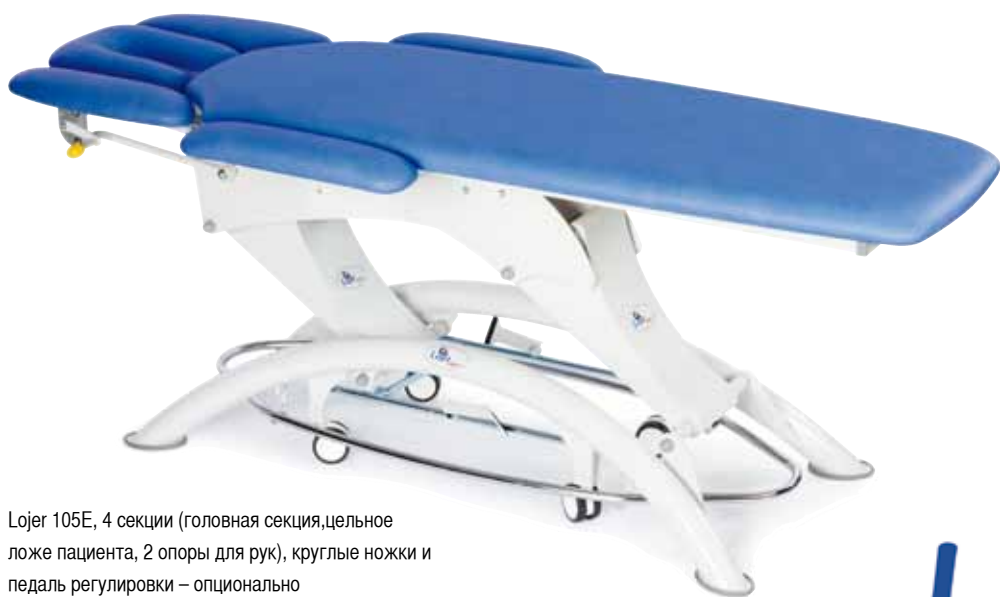
Lojer 105E, 4 секции (головная секция, целное ложе пациента, 2 опоры для рук), круглые ножки и педаль регулировки – опционально