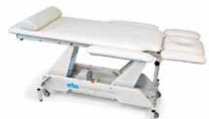
SNOW WHITE 6410907