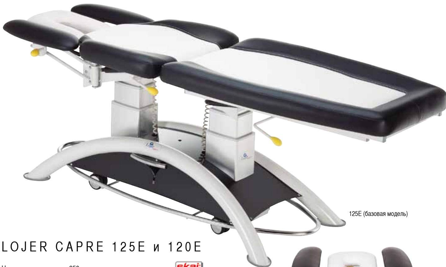
125E (базовая модель)