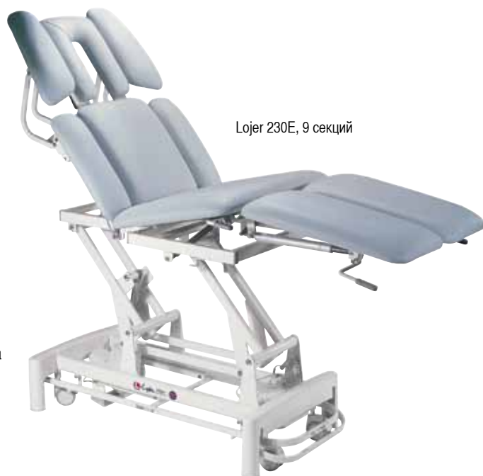
Lojer 230E, 9 секций

Стандартная девятисекционная модель имеет опоры для рук, регулируемые по высоте при помощи газовых пружин, семисекционная модель опор для рук не имеет. Обе модели имеют головную секцию с вырезом для лица. Регулировка угла головной секции от +30 до 90 град. Грудная секция с регулировкой угла положения (до +70 град.), имеет боковые регулируемые секции. Центральная ножная секция регулируется при помощи газовых пружин. Раздельные секции для ног с регулировкой угла (от +30 до -20 град.). Электрическая регулировка высоты при помощи педальной рамы в пределах 48-88 см. Центральная блокировка колес. Максимальная нагрузка 200 кг.