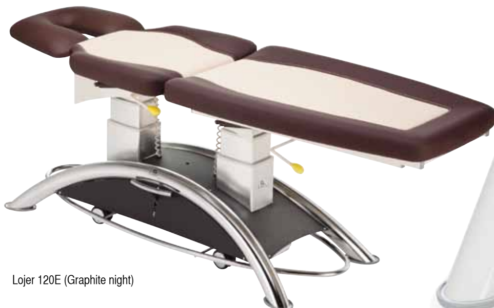
Lojer 120E (Graphite night)

В конструкции столов Lojer 120 и 125E применены две несущие колонны, позволяющие проводить бесшумную и плавную регулировку высоты. Различные дополнительные принадлежности (например, поворотные опоры для рук) делают работу врача проще. Педаль в виде овальной рамы дает возможность провести регулировку высоты стола, находясь с любой его стороны.