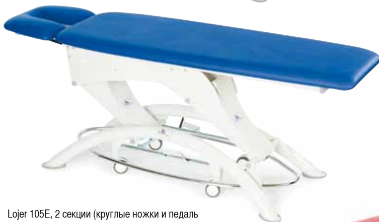
Lojer 105E, 2 секции (круглые ножки и педаль регулировки высоты - опционально)