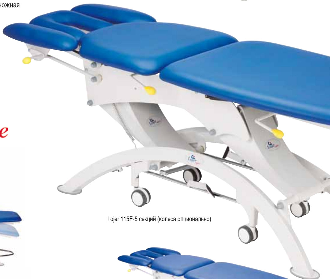
Lojer 115E-5 секций (колеса опционально)