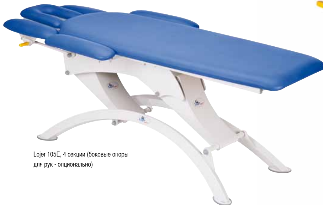
Lojer 105E, 4 секции (боковые опоры для рук - опционально)