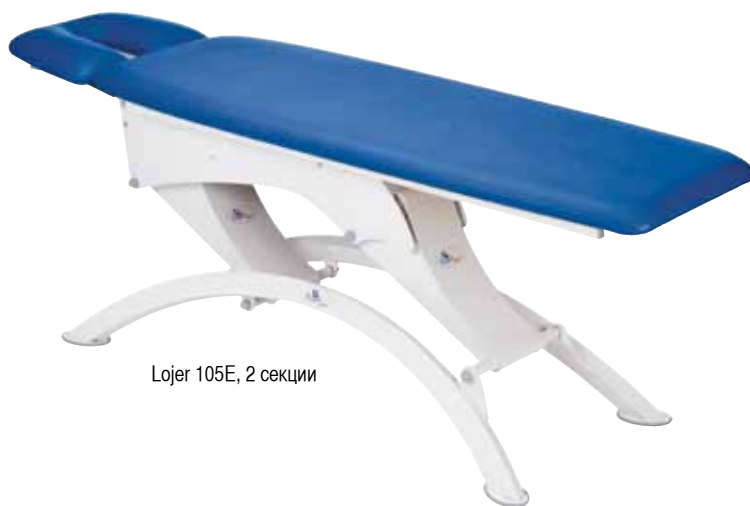
Lojer 105E, 2 секции

Гарантия: 10 лет на каркас стола, 2 года на мотор