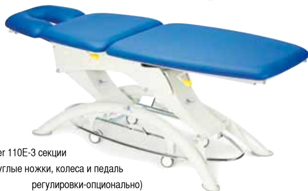
Lojer 110E-3 секции (круглые ножки, колеса и педаль регулировки-опционально)