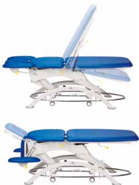
Lojer 115E-5 секций (колеса и педаль регулировки- опционально)