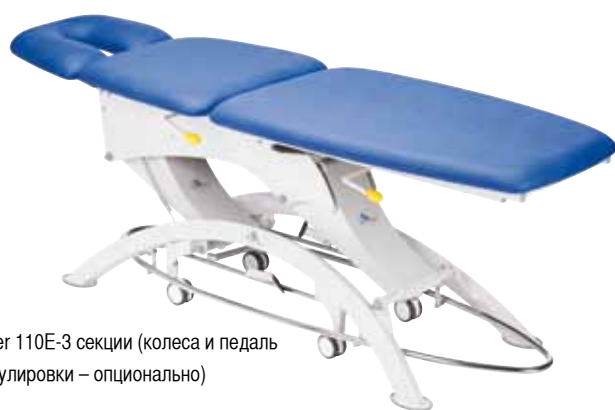
Lojer 110E-3 секции (колеса и педаль регулировки – опционально)